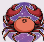
Rák (június 22. – július 22.)

A Kelyhek Nyolcas lapja azt üzeni, elég volt az önsajnálattól, a megszokásból, az ellaposodott kapcsolatból, a sehová sem vezető munkából. Válaszd magad, válaszd azt, akivé válhatsz! Indulj el az álmaid felé, hiszen te is tudod, hogy ennél többre vágysz. Lehet, hogy még nem teljesen tiszta a célhoz vezető út, de bízhatok benne, hogy a Hold és a Nap megmutatják a helyes irányt. Vond le a tanulságokat, hogy még egyszer ne ess ugyanabba a csapdába.