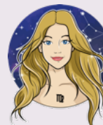
Szűz (augusztus 24. – szeptember 23.)

A Botok Tíz szerint már megint egyedül akarsz minden problémát megoldani, minden terhet magadra vállalni. Közel állsz hozzá, hogy elérd tűrőképességed határát. Nincs szükséged rá, hogy bizonyíts másoknak vagy magadnak. Nyugodtan adj le a feladataidból, az univerzum úgyis gondoskodik róla, hogy mindened meglegyen.