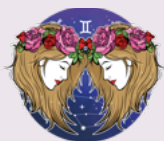
Ikrek (május 21. – június 21.)

A Bikák a Föld elem szülöttei, lételemük a biztonság és a stabilitás, főként a fizikai síkon mozognak. A Papnő lapja most mégis azt üzeni, itt az ideje szembe nézni azokkal a dolgokkal, amiket eddig elrejtettél magad és mások elől is. Rántsd le a leplet a félelemeidről, szabadulj meg a korlátozó hiedelmeidről, engedd el a nehezteleseidet. Ezek mind meggátolnak abban, hogy élvezd a bőséget és szeretetet, ami jár neked.