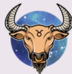
Bika (április 21. – május 20.)

A Kelyhek Hármas kártyája arra emlékeztet téged, hogy légy hálás a barátaidért, akikkel nem feltétlenül a vérvonal köt össze, hanem egy láthatatlan lelki szál. Mellettük az lehetsz, aki valójában vagy és akivé válni akarsz. Ha nehéz időszakon mész keresztül, fordulj hozzájuk támogatásért. Ha rég nem láttad őket, keresd velük a kapcsolatot, és ünnepeljétek meg barátságotokat.